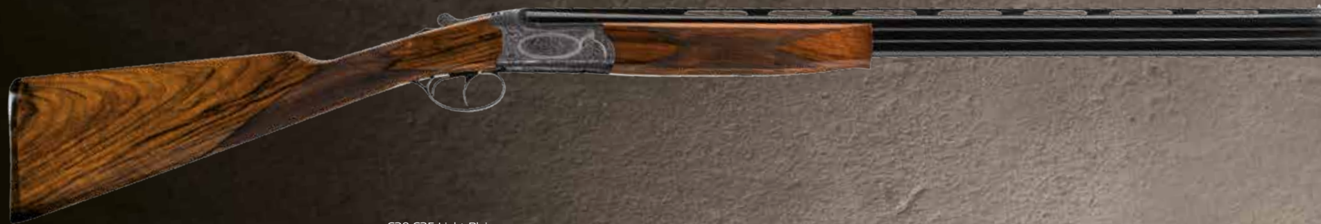
C30-C35 Light Plaine.