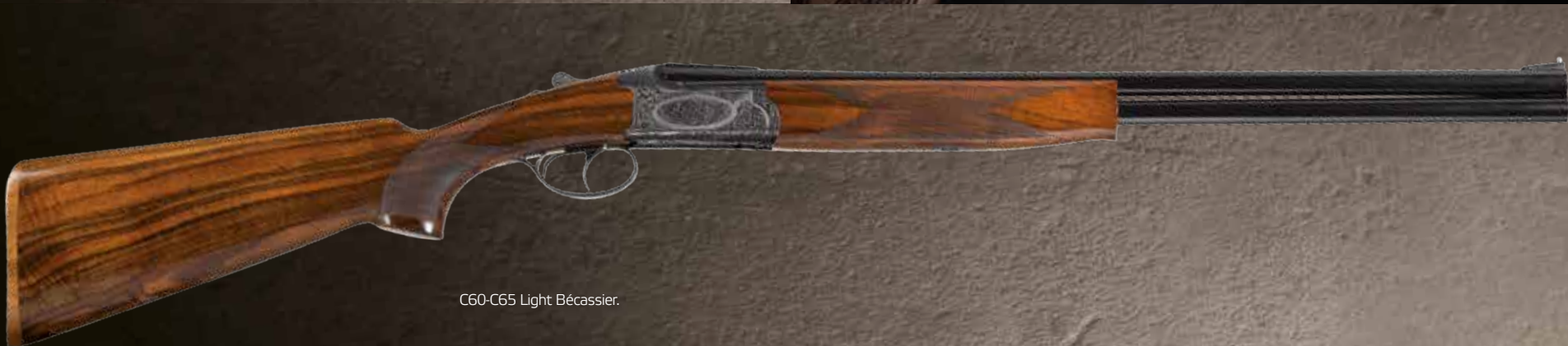
C60-C65 Light Bécassier.