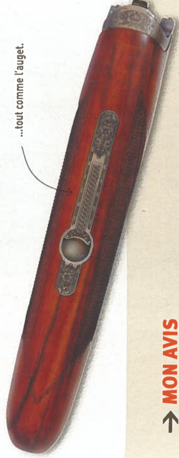
...tout comme l'auget.

leurs 66 cm de long, ses canons sont respectivement rayés en bas et choké 1/4 en haut ; une option qui nécessitera cependant de déboursier quelque 280 € de plus. Enfin, il est possible d'acquiescer une version livrée avec 5 rétreints amovibles (du lisse au full) contre 250 ou 320 € de plus selon les calibres. Il convient également de préciser que ce Super Orion Classique C35 est équipé dans la plus pure tradition d'un pontet court et d'une batterie Blitz à double détente. Là encore, moyennant 190 € supplémentaires, l'armurier français propose pour qui le souhaite une option mono détente, mais non sélective. ■